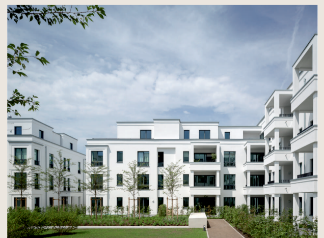
PANDION parkside, Düsseldorf