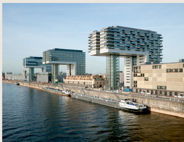
PANDION Vista, Köln